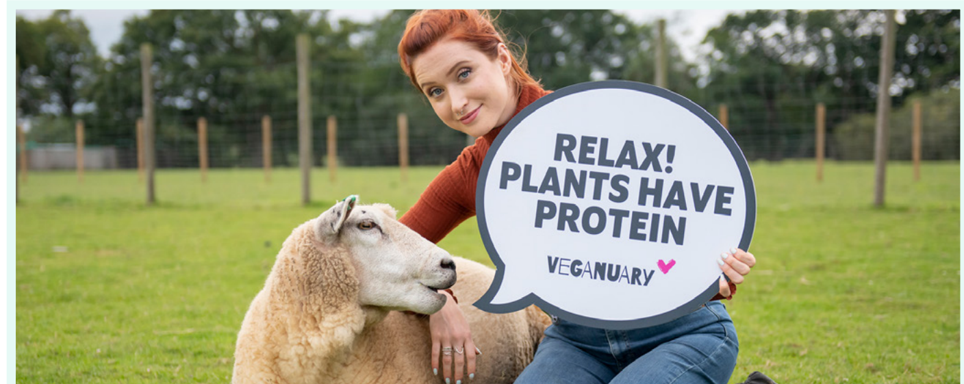
EVA O'HARA Estrela de "Hollyoaks"

Veganuary é mais do que um desafio: também apoiamos marcas, fabricantes e varejistas para expandir o alcance de suas opções plant based. No ano passado, milhares de empresas participaram de Veganuary , enquanto mais de 825 novos produtos à base de plantas e menus foram lançados incluindo Pret's Meatless Meatball Hot Wrap, M&S' No Salt Beef Pretzel Roll, Subway's Tastes Like Chicken Sub e a pizza sem frango da Domino's.